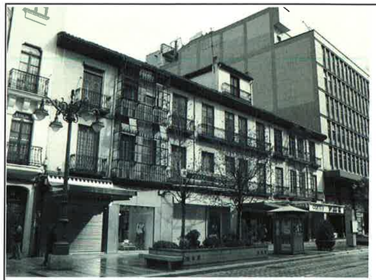
Fotografía del elemento catalogado en la Avenida de Ordoño II, nº12

El Plan Especial de Protección del Conjunto Urbano asigna un grado de protección 3 (Estructural) al inmueble en la correspondiente ficha del Catálogo de Edificación y Bienes Protegidos.