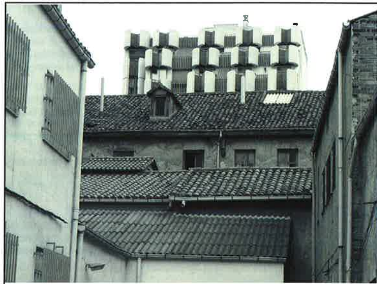
Vista de la fachada trasera del edificio desde el callejón de San Agustín

En cuanto al uso inicial del edificio, sede del Gobierno Civil, fue sustituido en su momento por el de usos privados, residenciales y administrativos. No dispone el edificio de ningún elemento que haga patente su uso inicial, limitándose este hecho a una reseña en el Catálogo. La planta baja es netamente comercial y no se corresponde con el diseño original.